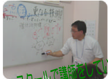
インストラクター